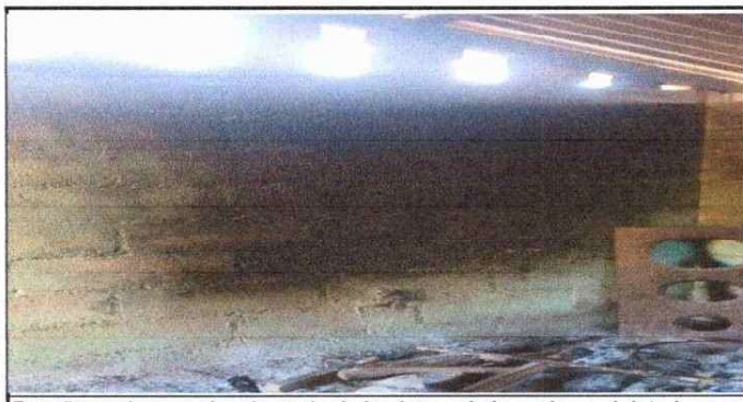
Foto 5: se observa el mal estado de la pintura de la cocina y el deterioro del mismo